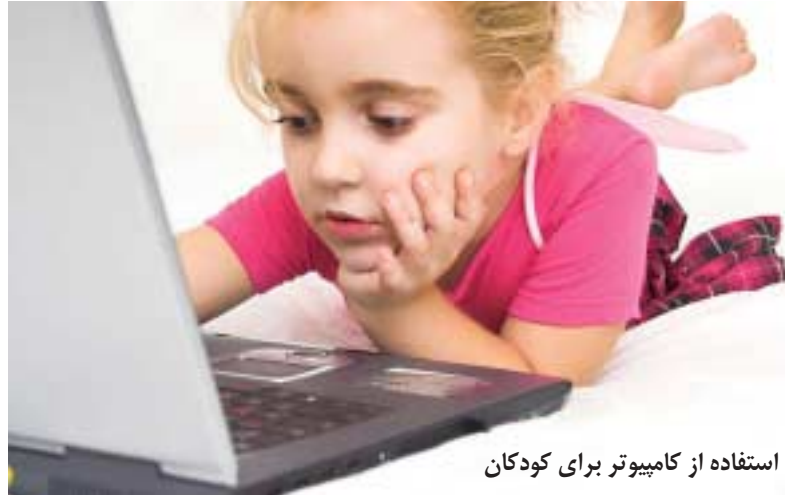
مدیریت زمان استفاده از کامپیوتر برای کودکان

به نظر شما وب کم مجازی چه کاربردهایی دارد؟ نرم‌افزار Video2webcam ابزاری منحصر به فرد برای ایجاد یک وب کم مجازی در رایانه شماست که با آن می‌توانید هر ویدئو کلیپی را که تمایل داشته باشید به کمک وب کم مجازی هنگام گفت‌وگوهای آنلاین (Chat) برای دوستانتان به نمایش بگذارید. به کمک این برنامه براحتی می‌توانید ویدئوهای مورد نظر خود را در ویدئو کنفرانس‌ها و دیگر محیط‌های گفت‌وگو آنلاین برای دیگران به نمایش بگذارید. همچنین می‌توانید هنگام چت کردن با بخش یک کلیپ مجازی، خود را به جای دیگران معرفی کنید! پشتیبانی از فرمت‌های مختلف تصویری و ویدئویی، قابلیت اجرا بدون نیاز به وب کم حقیقی و اجرای بدون دردسر در تمام برنامه‌های پیام‌رسان، از مهم‌ترین قابلیت‌های این نرم‌افزار به شمار می‌روند. نسخه محدود این نرم‌افزار با قابلیت اجرا در ویندوزهای ۲۰۰۰، اکس‌پی و ویستا با حجمی حدود ۵ مگابایت از این لینک قابل دریافت است: